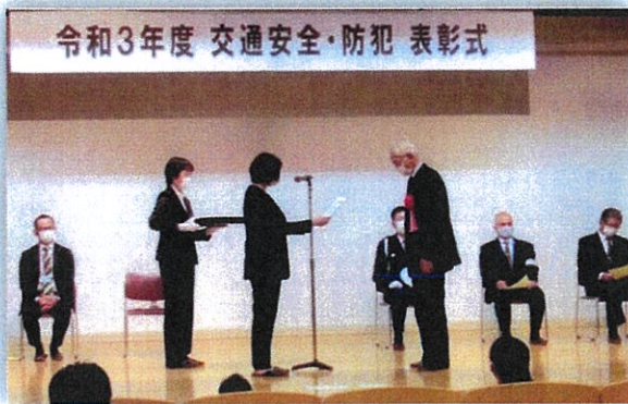
令和3年度 交通安全・防犯 表彰式