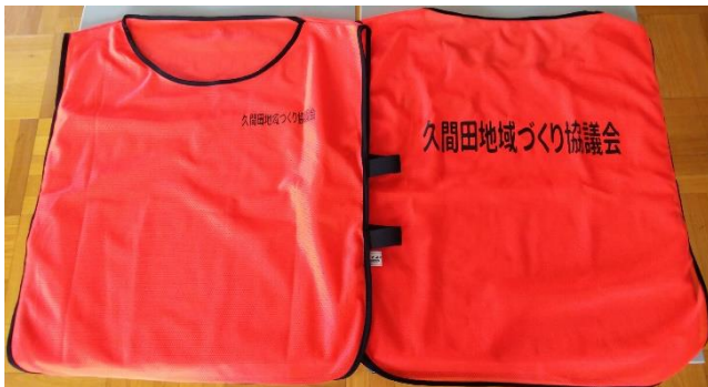
▲作成した蛍光オレンジのビブス

地域づくり協議会では、今年度の予算で、“久間田地域づくり協議会”とロゴの入ったビブスを100枚作成しました。